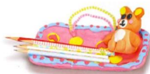
トレーを用いた作品