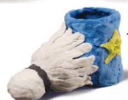
ペットボトルを用いた作品