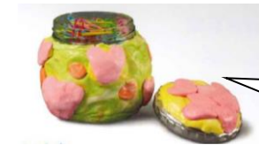
ビンを用いた作品

お子様と一緒に、 身近にある空き容器 （ペットボトル、ビン、カップ、トレーなど）を1～2個集めていただくと助かります。持ってくる日については担任から後日お知らせします。お手数ですがよろしくお願いいたします。