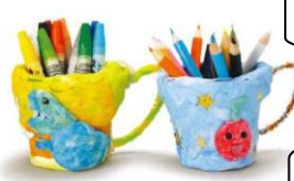
カップを用いた作品